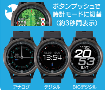
アナログ デジタル BIGデジタル