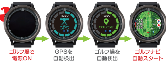
ゴルフ場で電源ON → GPSを自動検出 → ゴルフ場を自動検出 → ゴルフナビ自動スタート

ゴルフ場で電源ONすると、自動でGPS・ゴルフ場を検出します。ティーイングエリアへ移動すると、自動でゴルフナビがスタートします。